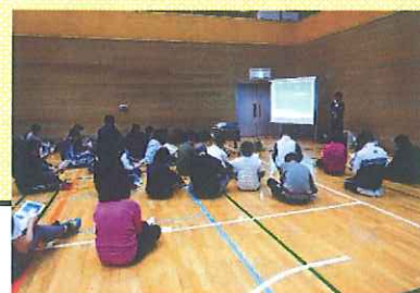
過去実施したセミナーの様子