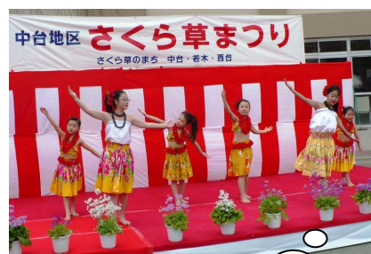
フラ&ケイキフラのステージ

若木小寺子屋事業 2月26日（日） 参加者 29名 スポーツ吹き矢で協力！中台若木町会 が矢を寄付してくれました